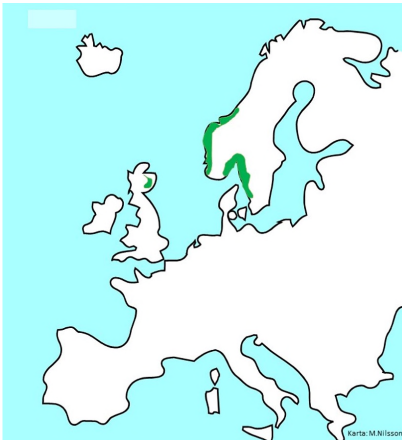
Suboceanisk granskog i Europa. Kustnära läge. Suboceaniskt klimat (mycket regn och milda vintrar). Specifika sydvästliga "barrskogsarter".

Särskilt viktigt i detta sammanhang är att många av de skyddsvärda skogarna som inte omfattas av strategin utgörs av Västlig taiga (9010) som är en skogstyp som finns utpekad som prioriterad och särskilt skyddsvärd i EU:s art- och habitatdirektiv. Detta är särskilt allvarligt då Västlig taiga är en skogsnaturtyp som minskar starkt i Sverige (se vidare nedan). En minskning som sker trots att detta står i strid med EU:s art- och habitatdirektiv. Eftersom Västlig taiga utgörs av mark som ofta är av mycket stort intresse för skogsbruk att bruka så är minskningen i Sverige av denna naturtyp särskilt stor. Att skogstypen inte heller särskilt pekats ut som prioriterad i den nationella strategin för skydd bidrar säkert starkt till dess nationella minskning. För Västra Götalands del är troligen minskningen av Västlig taiga mycket stor då strategin här generellt inte alls omfattar barrskog med höga naturvärden. Nuvarande strategi kan därför sägas ha bidragit till en mycket stor minskning av Västlig taiga i länet.