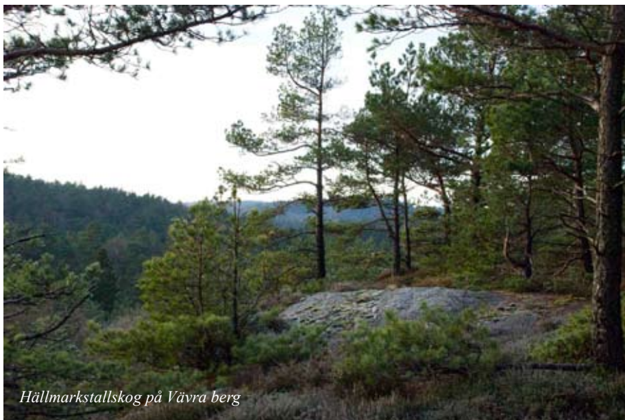
Hällmarkstallskog på Vävra berg

Vi gläds med uvarna och önskar god häckning!