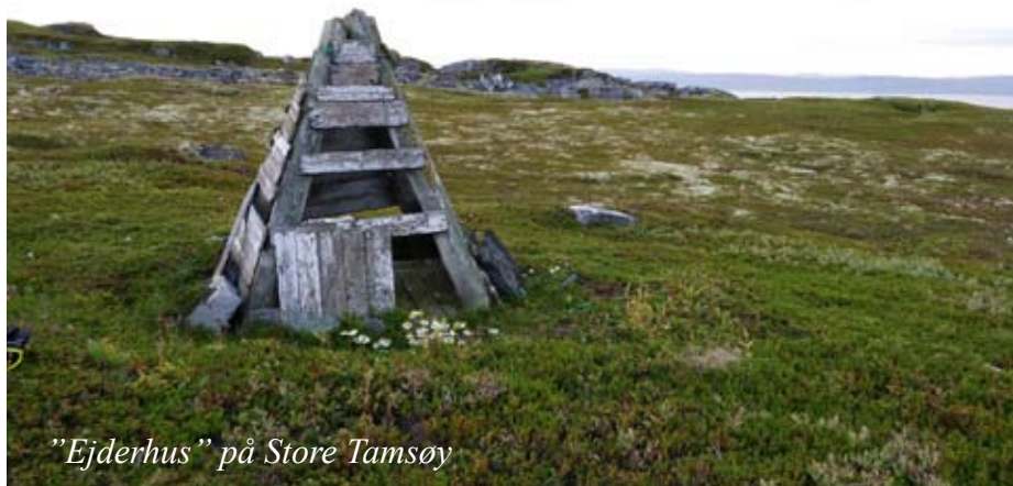
"Ejderhus" på Store Tamsøy